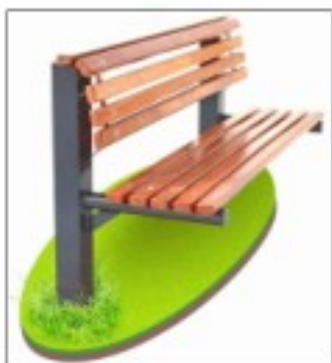
Рис. 1 Скамья "DMETAL", г. Ижевск