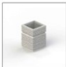
Вариант. Урна из бетона, вместимостью, 50л, код 7112, КСМТ