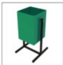
Рис. 1 Урна металлическая 50 л