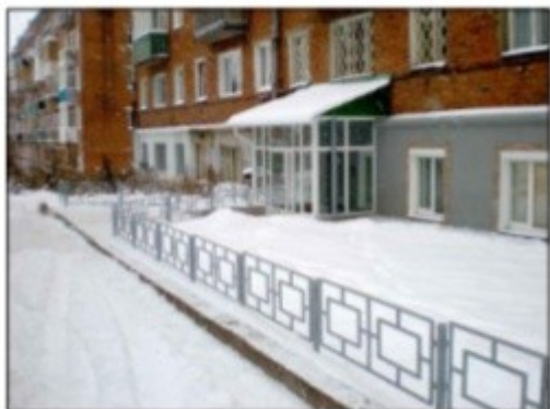
Рис. 1 Общий вид ограждения СГО-7